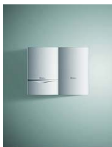
VU + VIH CK 70