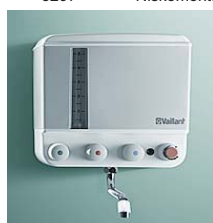
VEK 5 L