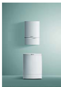
VU + VIH Q