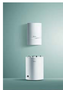
VU + VIH CR