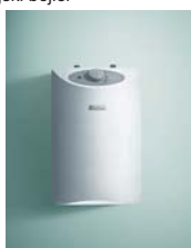
VEN 5 U