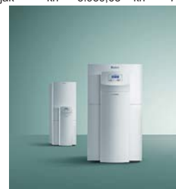
toplinska crpka geoTHERM