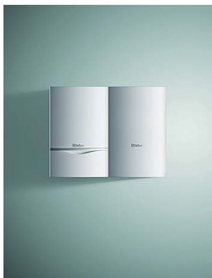
VU + VIH CB