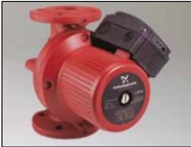
UPS(D) serija 200, priрубničke