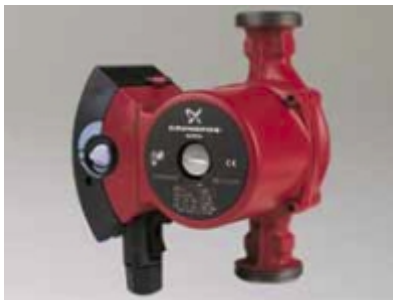
UP, UPS serija 100, navojne