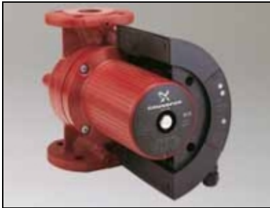
MAGNA UPE serija 2000